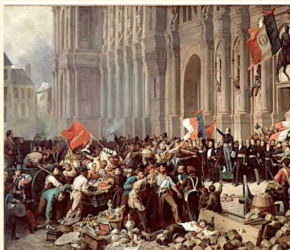
Felix Philippoteaux, Lamartine dans la révolution de 1848

Ce quatrième cours mettra d'avantage l'accent sur l'histoire : la révolution de février et la 2 e république qu'elle instaure sont suivies du coup d'état de Louis-Napoléon Bonaparte qui en défait les principes en devenant empereur. Frédéric vit ces événements avec le détachement et la distance qui traduisent la désillusion de sa génération.