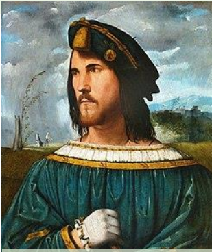
Portrait supposé de César Borgia par Altobello Melone. Académie Carrara, Bergame.