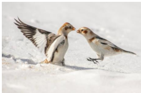
Plectrophanes des neiges Photo de René Lortie, Cap Tourmente, 2007

DES CONFÉRENCES DES COURS, DES ATELIERS en salle et en ligne