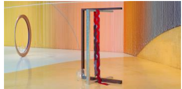
Kapwani Kiwanga: Trinket [Pacotille], 2024, Pavillon du Canada. La Biennale di Venezia.

L'installation vidéo de Anri Sala au MBAM est adaptée de l'œuvre Ravel Ravel (2013), exposée pour la première fois à la 55 e Biennale de Venise.