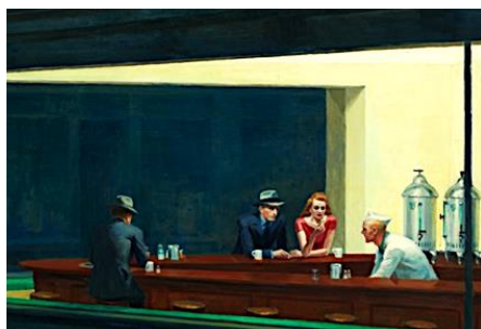
Oiseaux de nuit, détail Edward Hopper, Nighthawks , 1942 Art Institute Chicago

5625, av. Decelles, Montréal, H3T 1W4 514.342.9342, poste 5412 Métro Côte-des-Neiges Autobus 119, 51, 129, 165